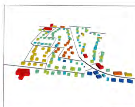
Für jedes Gebäude wird der Wärmebedarf auf Grundlage einer individuellen Beschreibung des Gebäudes errechnet.

lung Klima und Energie des Landkreises Osnabrück. Zugang hätten derzeit nur die Bürgermeister der entsprechenden Kommunen. Die Chancen, die sich daraus ergeben, dass auch Unternehmen einen Überblick darüber erhalten, wo in ihrer Nachbarschaft Wärme benötigt wird oder wo Nah- und Fernwärmenetze verlaufen, in die ihre Prozesswärme eingespeist werden kann, bleiben damit fürs erste ungenutzt.