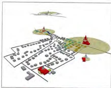
Darstellung der Abwärmeverfügbarkeit: Wirkradien machen deutlich, wie viel Abwärme, in welchem Umkreis nutzbar wäre.