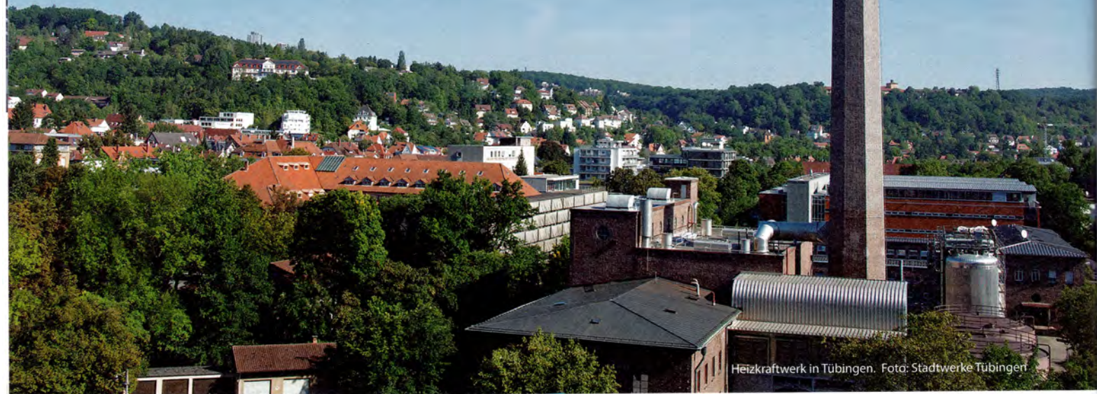
Heizkraftwerk in Tübingen.

Weltweit geht ein Großteil der industriell eingesetzten Energie als Abwärme verloren, obwohl sie noch genutzt werden könnte. Um diese Potenziale zu heben ist es nötig, die industriellen Abwärmequellen und Wärmesenken – also Gebäude und Unternehmen, in denen Wärme benötigt wird – systematisch zu erfassen. Das Interesse an der Erstellung entsprechender Wärmekataster steigt, berichtet Dorothea Ludwig von IP Syscon. Das Unternehmen hat mit dem Wärmekompass eine modular aufgebaute Lösung zur Identifikation und Quantifizierung von Abwärmequellen und Wärmesenken entwickelt.